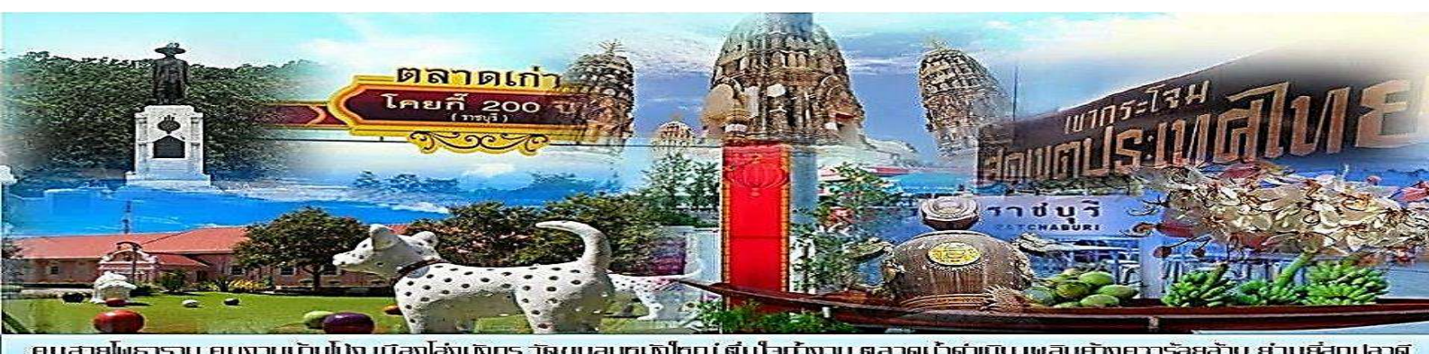
คนสวยไพเราะ คนงานบ้านโป่ง เมืองไร่เกษตร วัฒนชนกของไทย สืบไปทำงาน ตลาดเก่าเด่น เพลิดเพลินความรื่นรมย์ ย่านยึดปลาดี